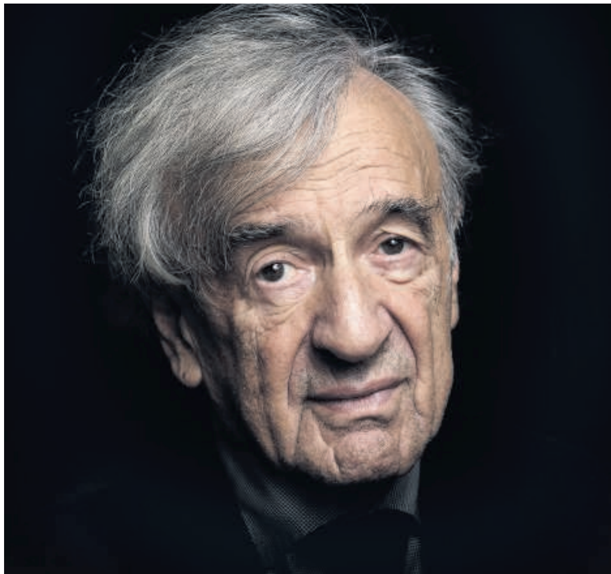
Buchenwald, gefotografeerd door hun bevrijders van het Amerikaanse leger met Elie Wiesel op de middelste rij, zevende van links. Rechts: Wiesel in 2011.

deren woonde Wiesel een tijdlang in een tehuis in Normandië. Hij leerde Frans en ging in 1948 literatuur, filosofie en psychologie studeren aan de Sorbonne. Daar kreeg hij college van onder meer Martin Buber en Jean-Paul Sartre. Hij bekostigde zijn studie via journalistieke bijdragen aan de krant L'Arche , waarvoor hij onder meer de geboorte van de staat Israël in 1948 versloeg. Naar aanleiding van zijn verblijf in Israël werd Wiesel tevens de Parijse correspondent van de Israëlische krant Yedioth Ahronoth .