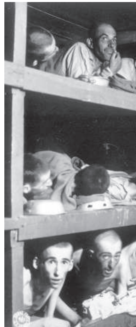
Overlevenden in concentratiekamp

■ ...TOCH RAAKT DE ZEE NIET VOL (1999) Memoires deel 2: Wiesel als onvermoebaar, internationaal opererend strijder tegen haat, onderdrukking en vooroordeel.