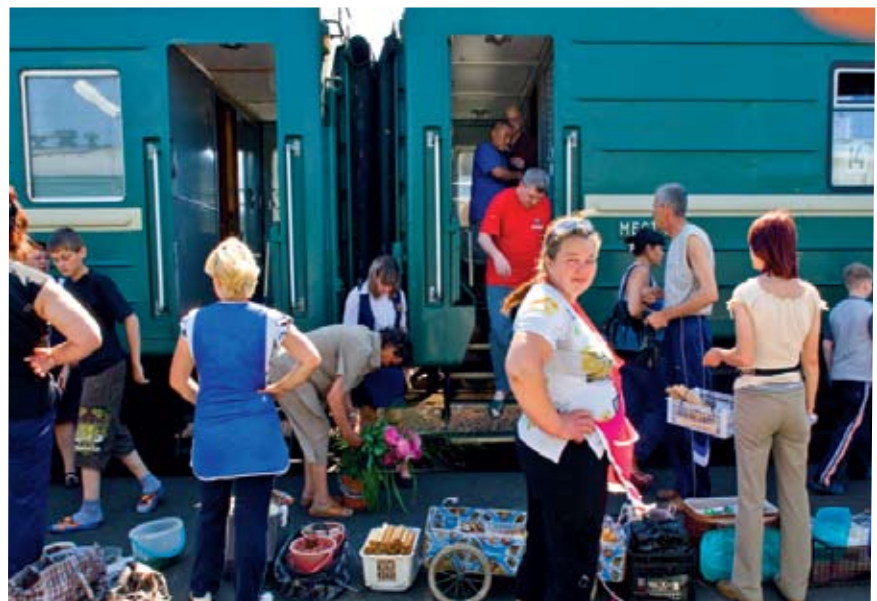
Bewoners van Ilanskaya verkopen drank en zelfgemaakte hapjes op het station.

Lees meer over de hoogtepunten van Rusland op www.plusonline.nl/rusland