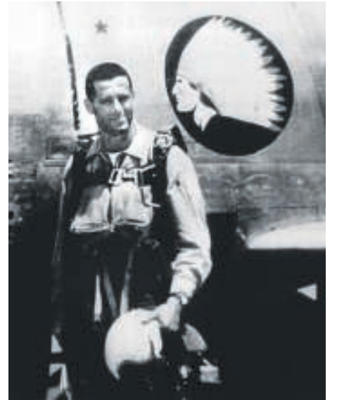
James Salter als gevechtspiloot tijdens de Koreaanse Oorlog, 1952.

Groot was de verrassing toen in 2013, 34 jaar na Salters vorige roman, All That Is het licht zag: een prachtig