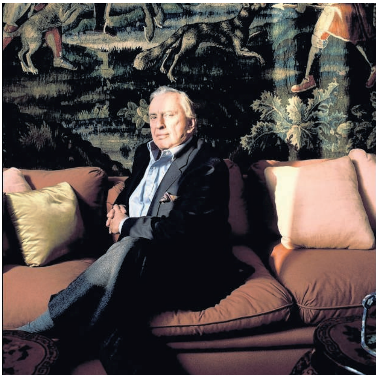
Gore Vidal in 1993 in zijn huis in Rome. Hij overleed dinsdag in zijn huidige woonplaats Los Angeles.

In de jaren vijftig hield Vidal zich vooral bezig met het lucratieve