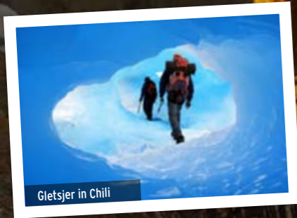
Gletsjer in Chili