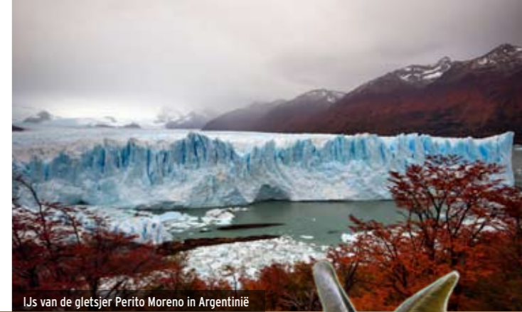
IJs van de gletsjer Perito Moreno in Argentinië