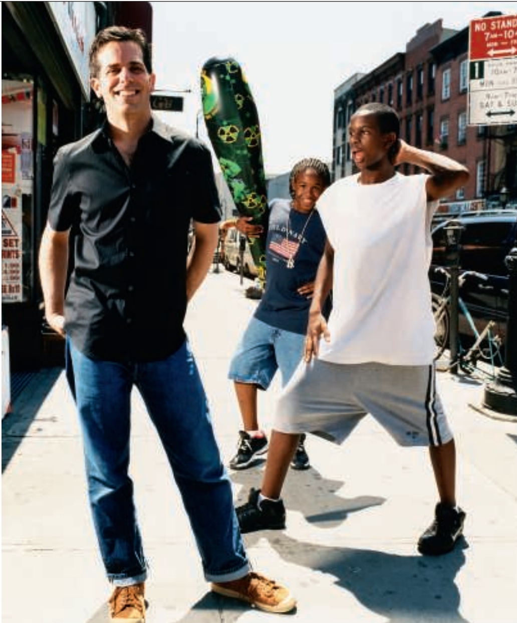
Jonathan Lethem in Brooklyn, New York: 'Mijn ouders vonden het een goed idee om mij op een vrijwel zwarte school te doen.'