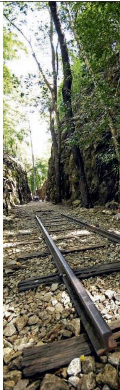
De Birma-spoorlijn loopt dwars door de Rangoon in Birma.

Het indrukwekkendste tafereel, bijna hallucinatoir, speelt zich af in het hart van de roman, als Evans onder onmogelijke omstandigheden een gangreneus been probeert af te zetten om zo een zekere dood te voorkomen. Tegelijkertijd is zijn aanwezigheid nodig om het leven van