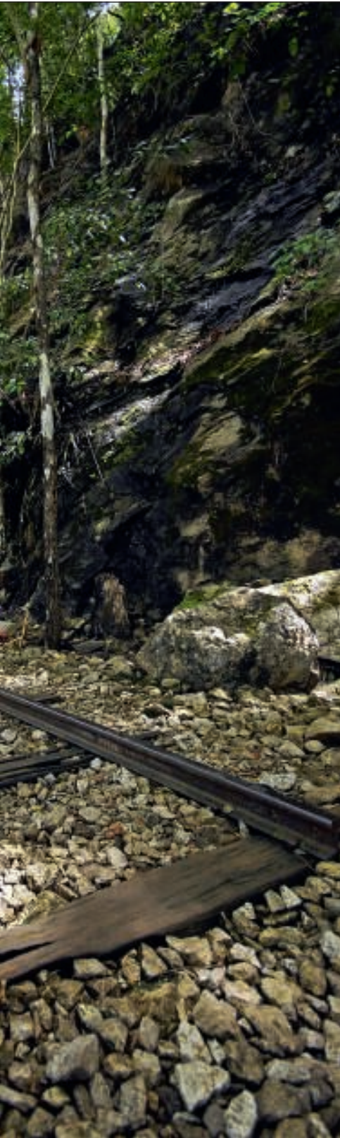
jungle van Bangkok in Thailand naar

borend onderzoek naar morele zelfrechtvaardiging en justitiële willekeur als een krachtige evocatie van een gruwelijke periode in de moderne geschiedenis. Het werk van een schrijver op de toppen van zijn kunnen, die aanstaande dinsdag best eens zou kunnen worden bekroond met de Man Booker Prize. Geheel terecht.