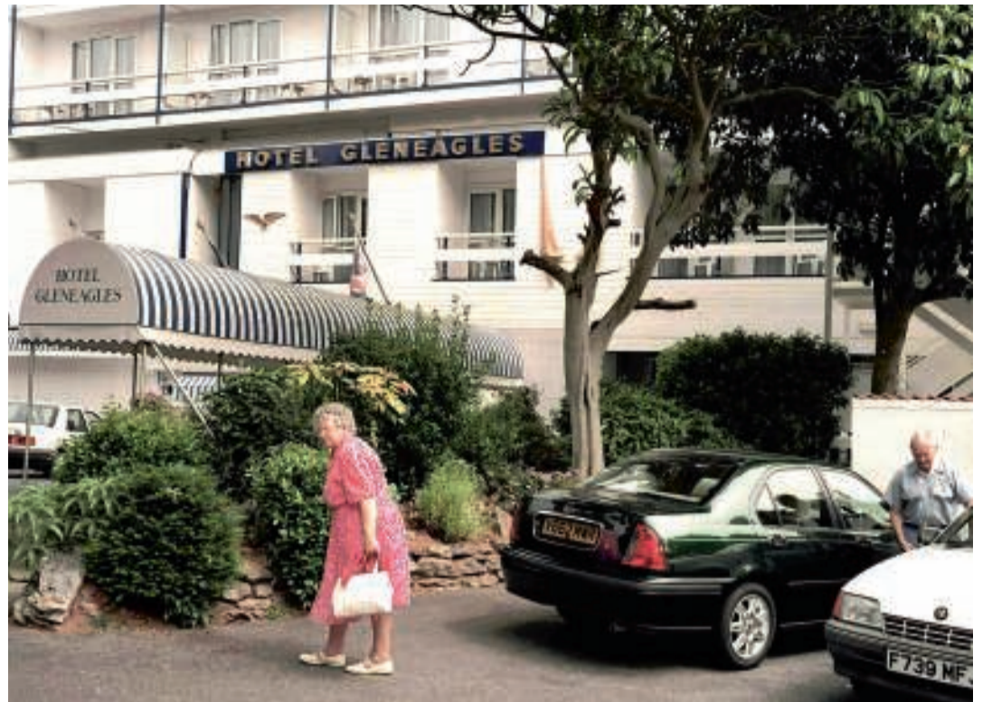
Links een buitenopname van 'Hotel Fawlty Towers', in werkelijkheid de Wooburn Grange Country Club in Buckinghamshire. Rechts het Gleneagles Hotel, waar het idee voor Fawlty Towers ontstond.