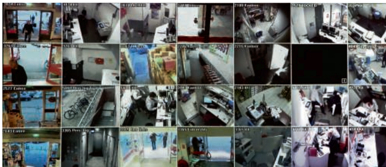
Camerabeelden in de beveiligingscentrale van een supermarkt in Sassenheim.