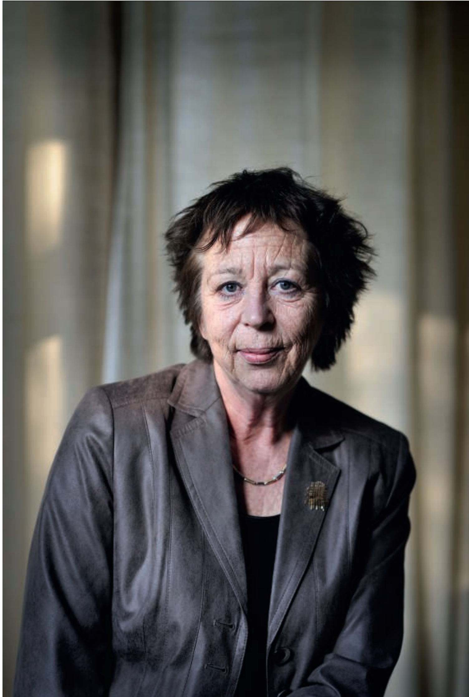
Renate Dorrestein: 'Ik durfde mijn werkkamer letterlijk niet meer binnen te gaan.'

1996 Verborgene gebreken 1997 Want dit is mijn lichaam (Boekenweekgeschenk) 1998 Een hart van steen 2001 Zonder genade 2003 Het duister dat ons scheidt 2010 De leesclub 2011 De stiefmoeder