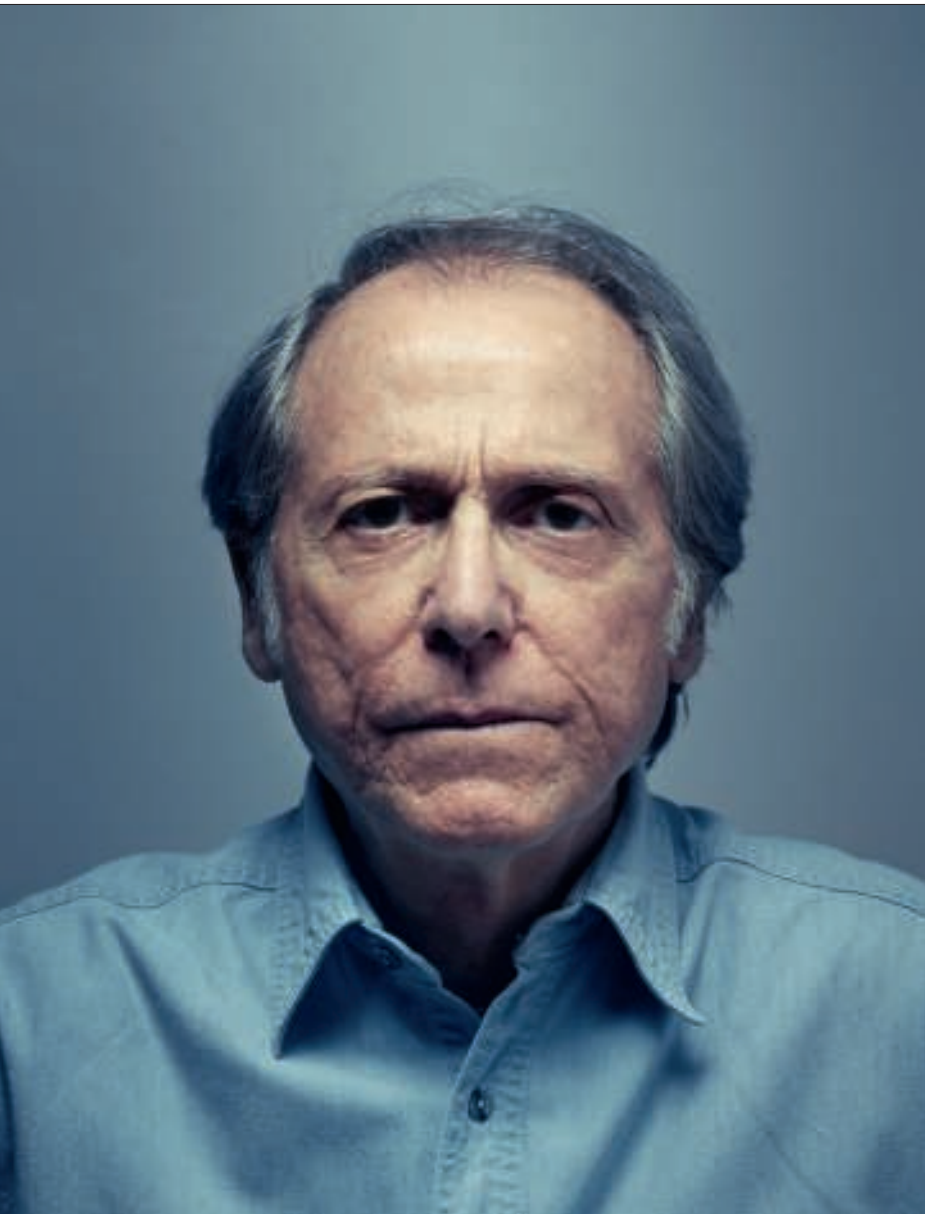
personages gaan hun eigen gang.'