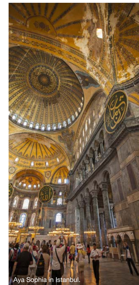
Aya Sophia in Istanbul.