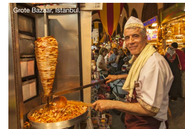
Grote Bazaar, Istanbul.

Over twee dagen zullen we de Blauwe Moskee vanaf zee kunnen zien liggen. Wonderlijk hoe je in een weekje cruisen de hoogtepunten van drie schitterende culturen - de Venetiaanse, de Griekse en de Ottomaanse - kunt beleven. En ondertussen ook nog een acupunctuurseminar en een cursus digitale fotografie hebt gevolgd. •