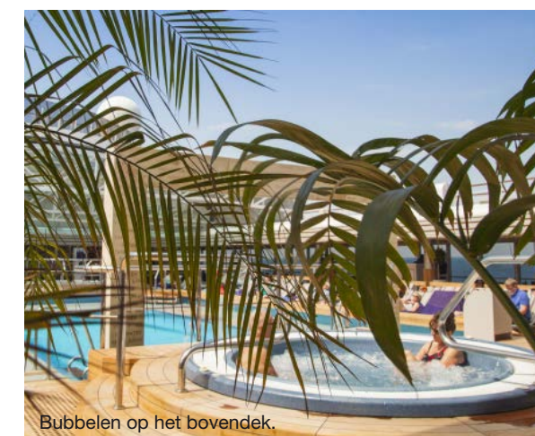
Bubbelen op het bovendeck.