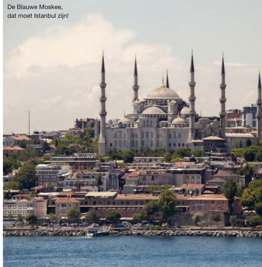
De Blauwe Moskee, dat moet Istanbul zijn!