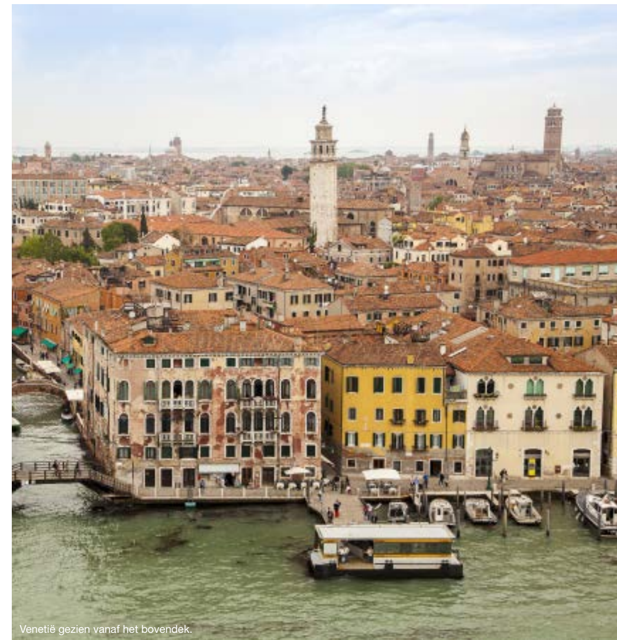
Venetië gezien vanaf het bovendeck.

het schip wordt aangedreven, over de aan de zijkanten geplaatste bow thrusters die het manoeuvreren veel gemakkelijker maken en over de vinstabilisatoren die ervoor zorgen dat de Nieuw Amsterdam stabiel door het water glijdt.