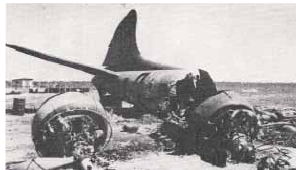
B-17 Flying Fortress op Broome Airfield

Van Hulssen is inmiddels 87 jaar en woont in Melbourne. Hij heeft weinig aanmoediging nodig om zijn verhaal te vertellen. 'Op 2 maart in de morgen waren wij in het geheim gestationeerd in Tulungagung, ten zuidwesten van Surabaya. Daar zag het zwart van de mensen: allemaal vluchtelingen die wij naar een onbekende plek moesten brengen. Ons vliegtuig kreeg 45 vrouwen en kinderen aan boord. Om veiligheidsredenen vertrokken we nadat de duisternis was ingevallen. Pas toen mochten we de verzegelde envelop openmaken waarin onze bestemming stond. Dat bleek Roebuck Bay bij Broome te zijn.' De Catalina Y-59 kwam daar iets na negen in de ochtend aan. Het was de bedoeling dat er zou worden doorgevlogen Perth, maar daarvoor had het toestel niet genoeg brandstof. 'Terwijl wij daarop zaten te wachten, liepen de