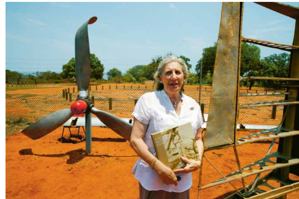
Verity Norman van het Broome Museum

aanval op te stijgen: een Amerikaanse B-24 met tientallen gewonden aan boord. Het toestel komt slechts een paar kilometer ver.