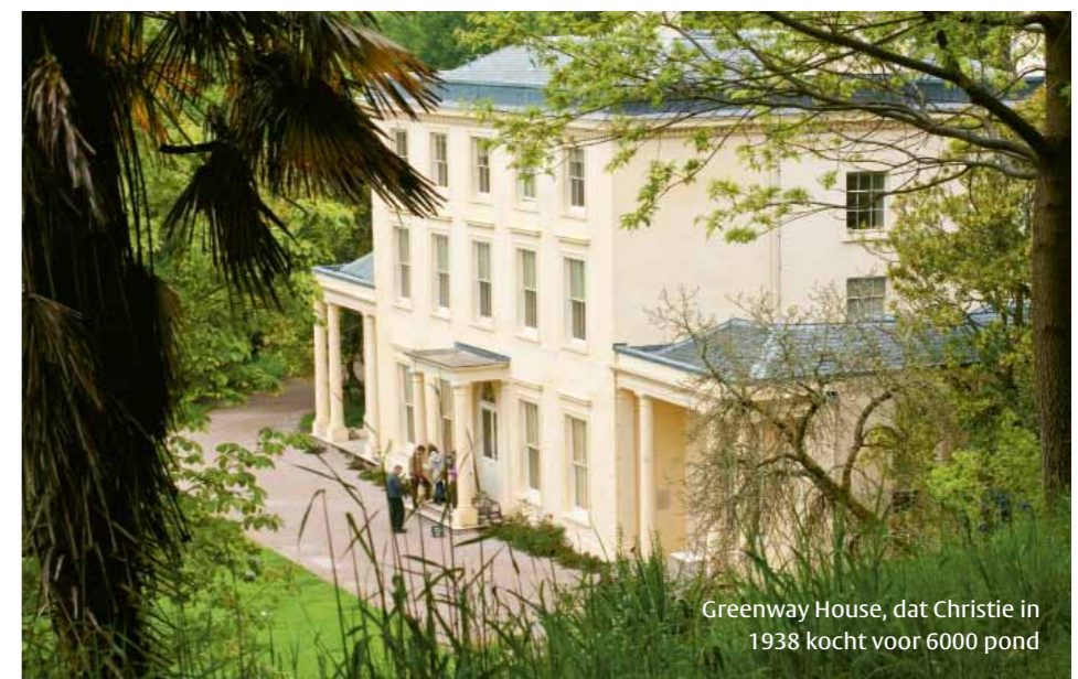
Greenway House, dat Christie in 1938 kocht voor 6000 pond

Treinreis Vanaf de Greenway Key, een paar honderd meter van het landhuis, vertrekt de Christie Belle, die bezoekers over de rivier de Dart naar het kustplaatsje Dartmouth voert. Vlak